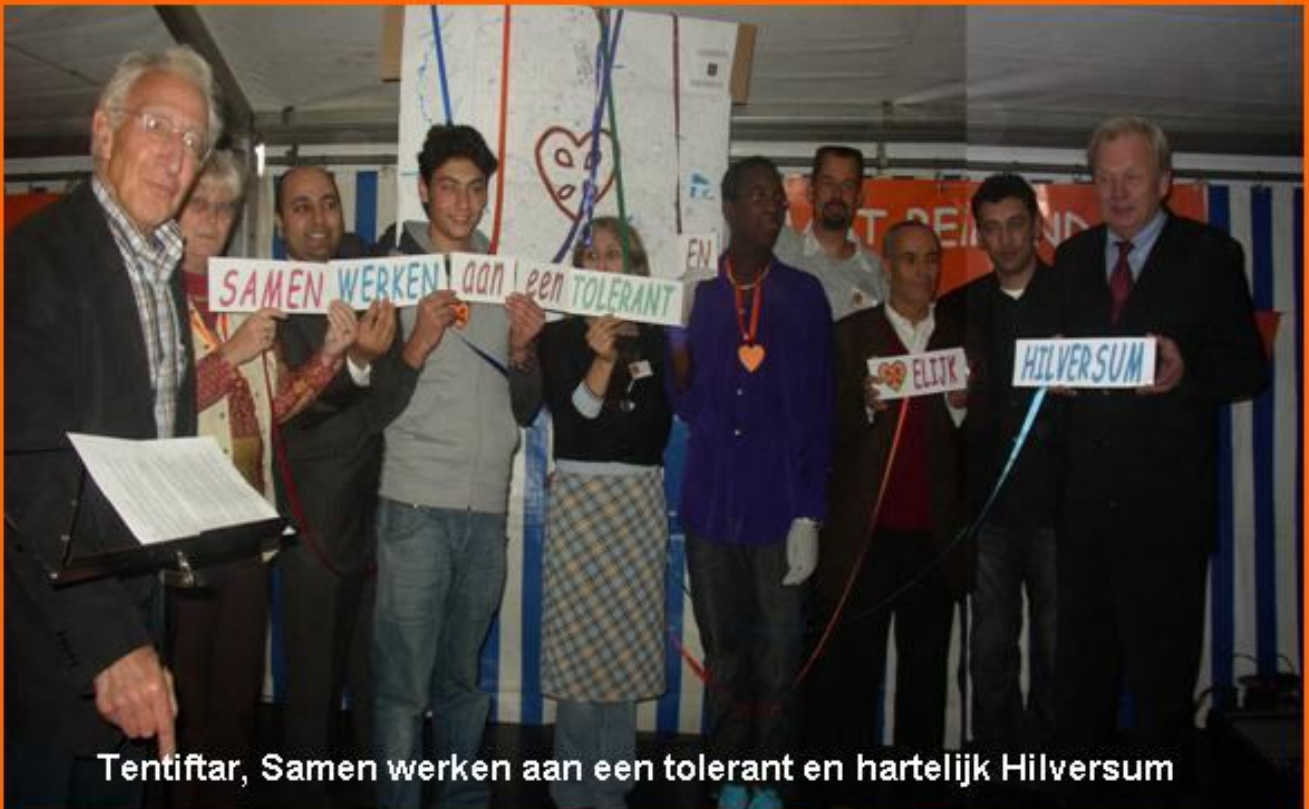
Tentifar, Samen werken aan een tolerant en hartelijk Hilversum