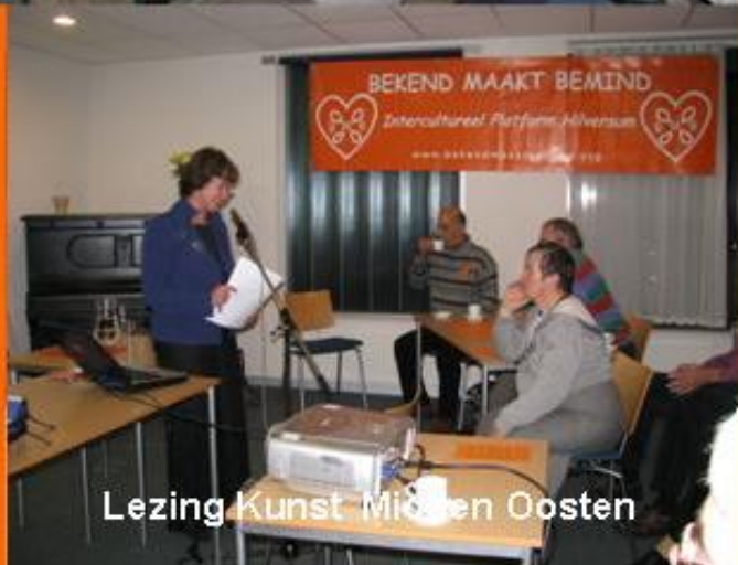
Lezing Kunst Midden Oosten