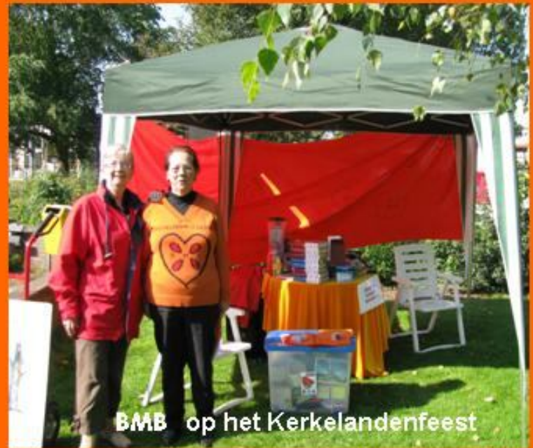
BMB op het Kerkelandenfeest