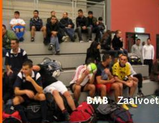
BMB Zaalvoetbal toernooi